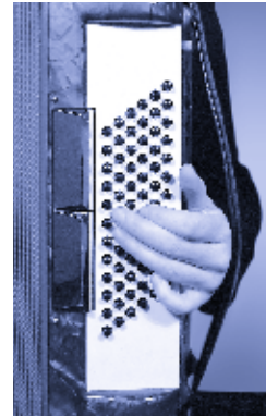
Die Stellung der Finger beim Greifen des Moll-Akkords mit Wechselbass

Der Grundbass wird mit dem 4. Finger und der Moll-Akkord mit dem 2. Finger gespielt. Nimm dir die Basstabelle und spiele die Moll-Akkorde sowohl im 4/4- als auch im 3/4-Takt durch alle dir zur Verfügung stehenden Tonarten.