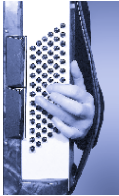
Die Stellung der Finger beim Greifen des Moll-Akkords

Der Grundbass wird mit dem 4. Finger und der Moll-Akkord mit dem 2. Finger gespielt. Nimm dir die Basstabelle und spiele die Moll-Akkorde sowohl im 4/4- als auch im 3/4-Takt durch alle dir zur Verfügung stehenden Tonarten.